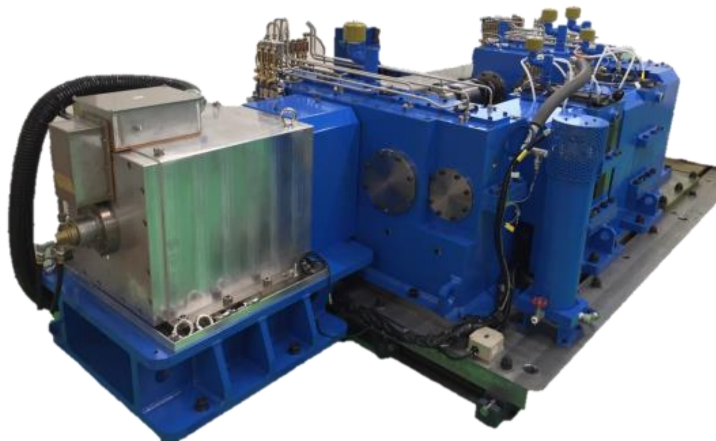
歯車試験機 Gear Tester