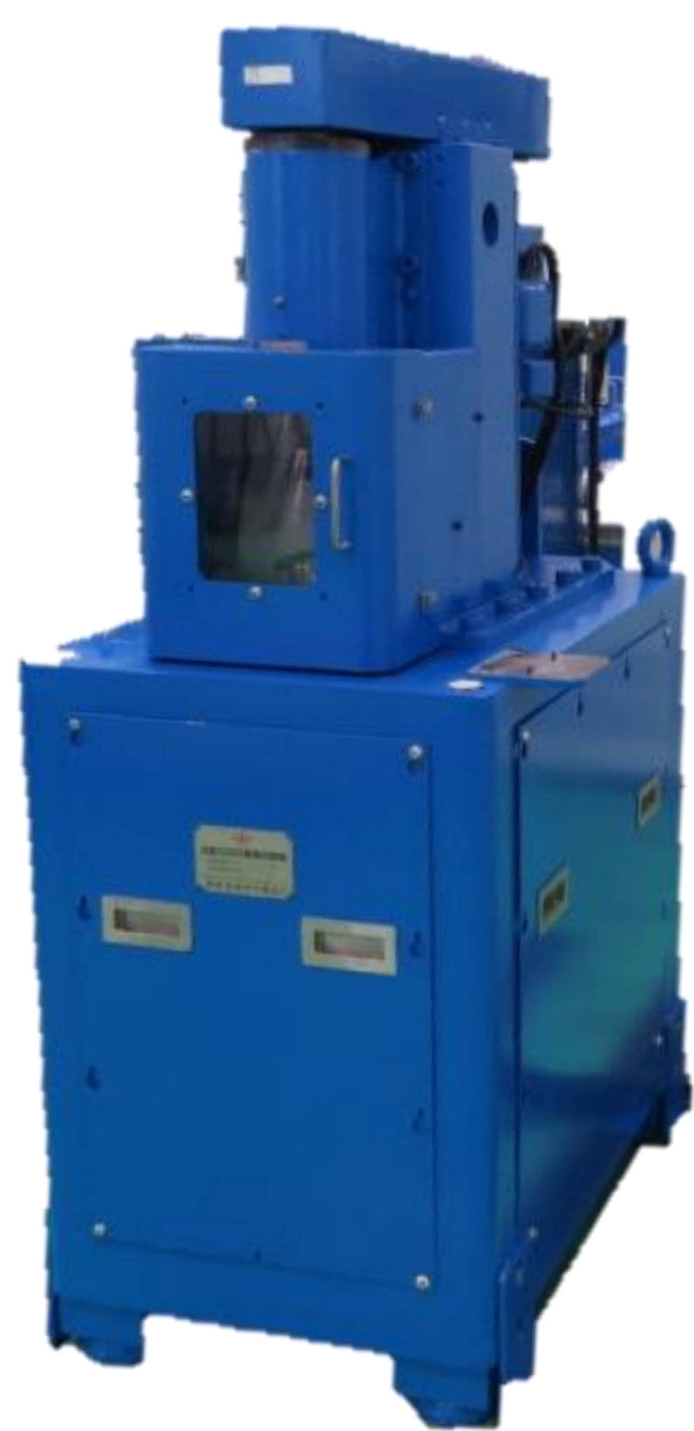
摩擦摩耗試験機 Friction & Wear Tester