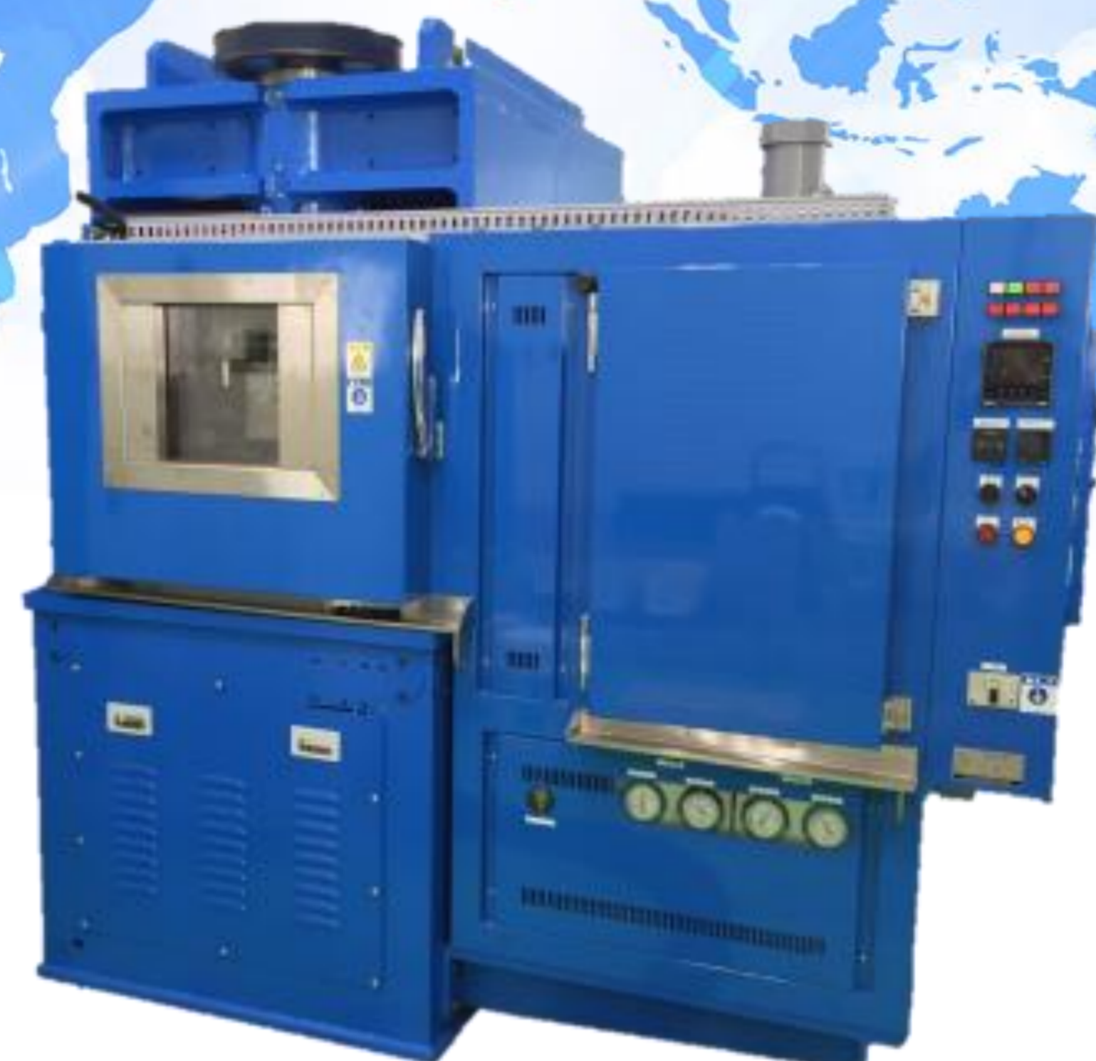
クラッチ低速滑り試験機 L.V.F.A.