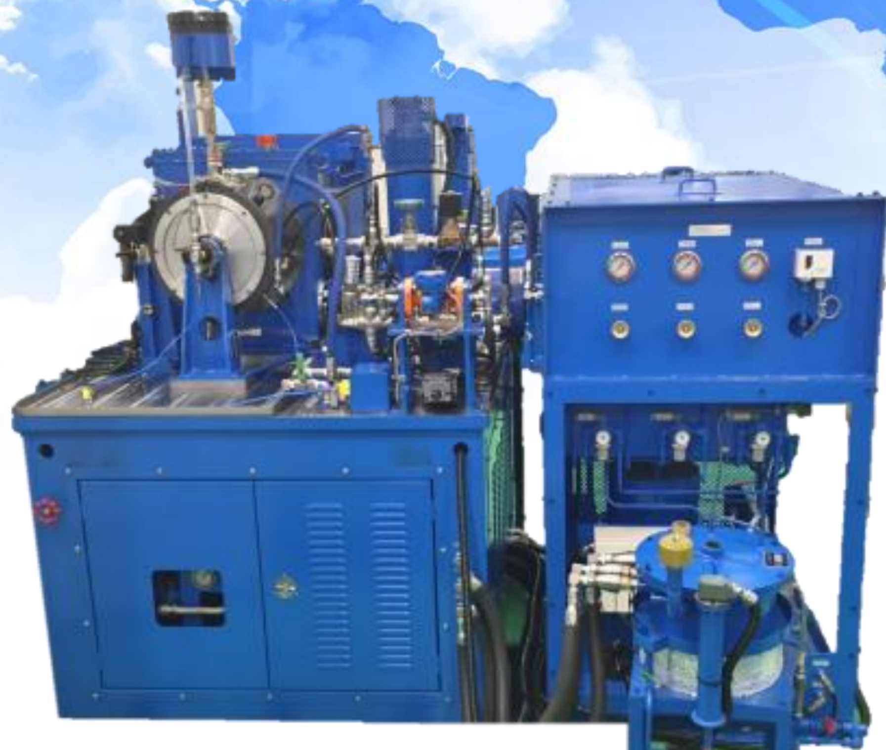
クラッチ摩擦試験機 SAE No.2 Tester