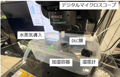
Fig. 1 Observation of water adsorption.